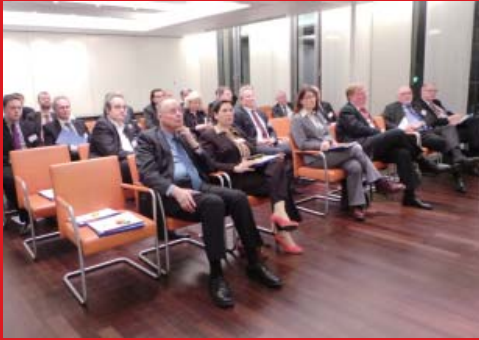
与会嘉宾认真听取专家带来的精彩演讲