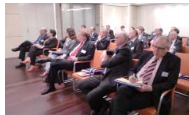
17 德国中国工商会 2013 年 2 月会员活动