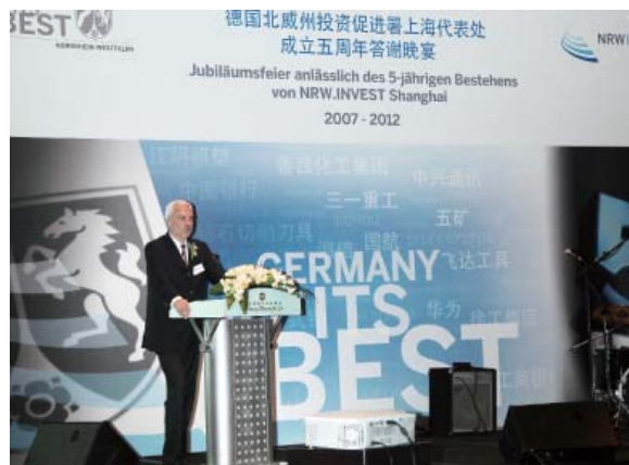
在德国北威州投资促进署上海代表处成立五周年答谢晚宴上讲话

这种现象始于 1997 年香港回归期间，但是这些移民的数量对于一个人人口十三亿的大国来讲是微不足道的。对于他们这样做是想寻找更好的生活还是想优化他们的资产，我无法给出定论。