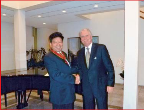
马灿荣先生（左）与施明贤大使