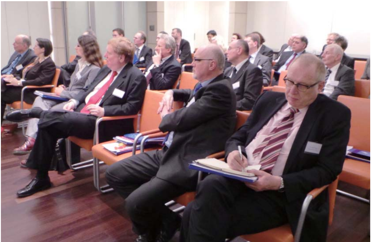
与会现场