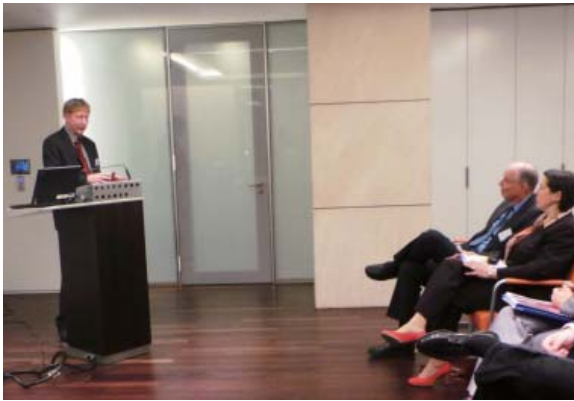
海贝勒教授为大家带来精彩的演讲

海贝勒教授是著名的政治学家，他为中德两国的文化交流做出了积极的贡献。为了对中国及其政治、文化结构进行研究，海贝勒教授在中国生活了很长时间。世界各地的媒体奉他为中国问题专家，因为鲜有外国人能像他一样，从中国内部来观察这个庞大的国家。