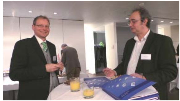
充满轻松、愉快气氛的自助晚餐

活动结束后与会嘉宾享受了丰盛的自助晚餐，大家有充裕的机会叙旧，同时又结交了新朋友。